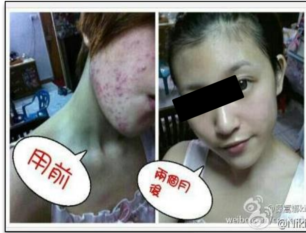
不得出現前後對比照片