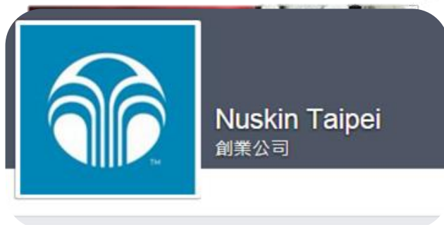
不適當的商標及公司名稱使用