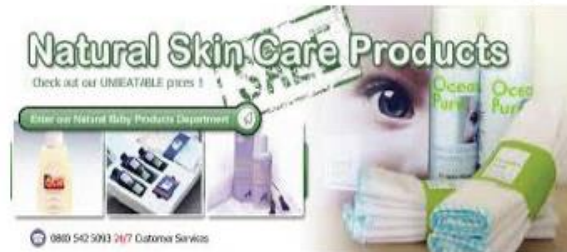
禁止的電子商務行為